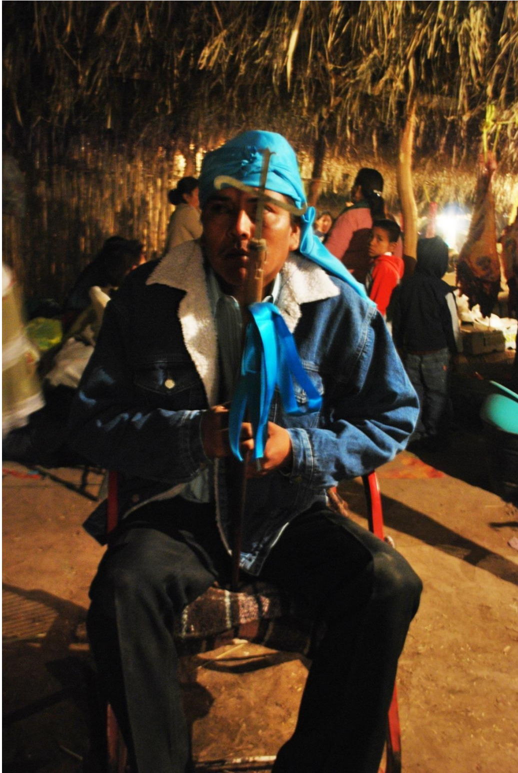
Fiestero azul haciendo guardia en la ramada donde se encuentra ubicada la cocina.