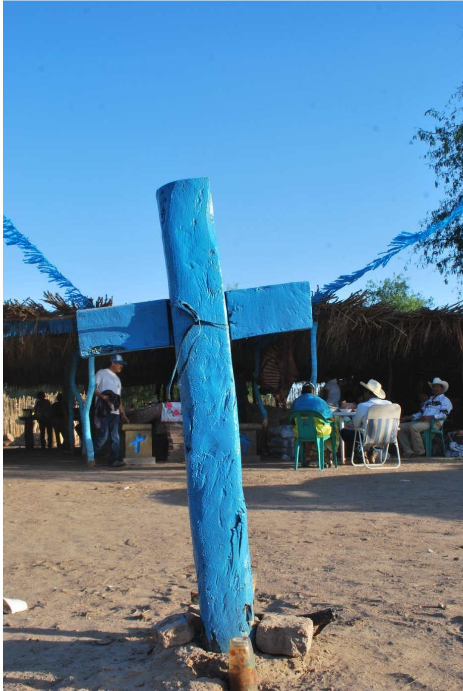
Cruz de los fiesteros azules.