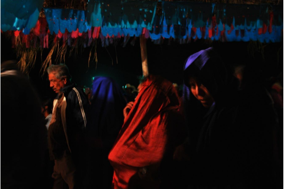
Cantoras en la víspera de la Santa Cruz el 2 de Mayo durante la misa cantada.