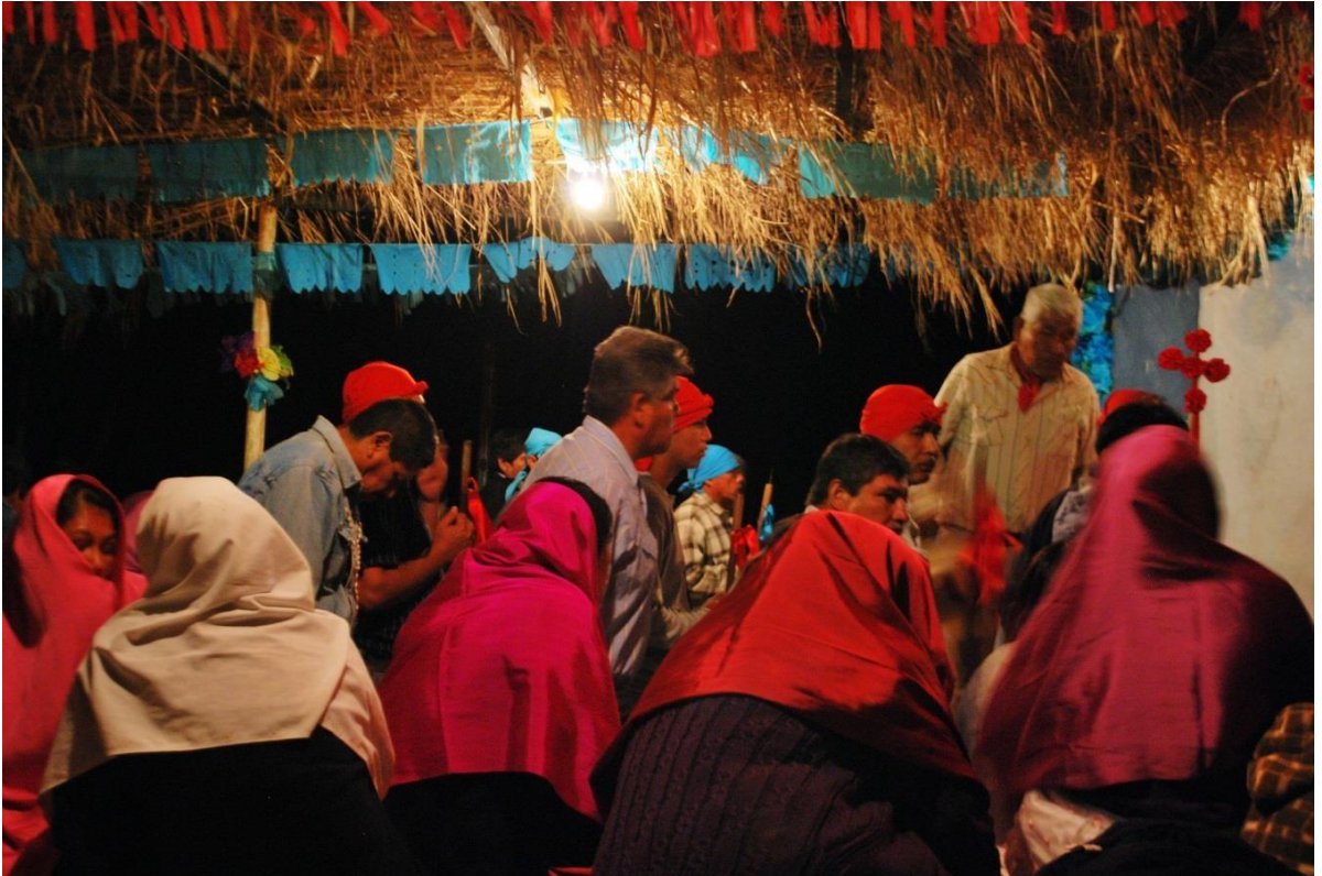
Fiesteros rojos y azules durante la misa cantada el 2 de Mayo.