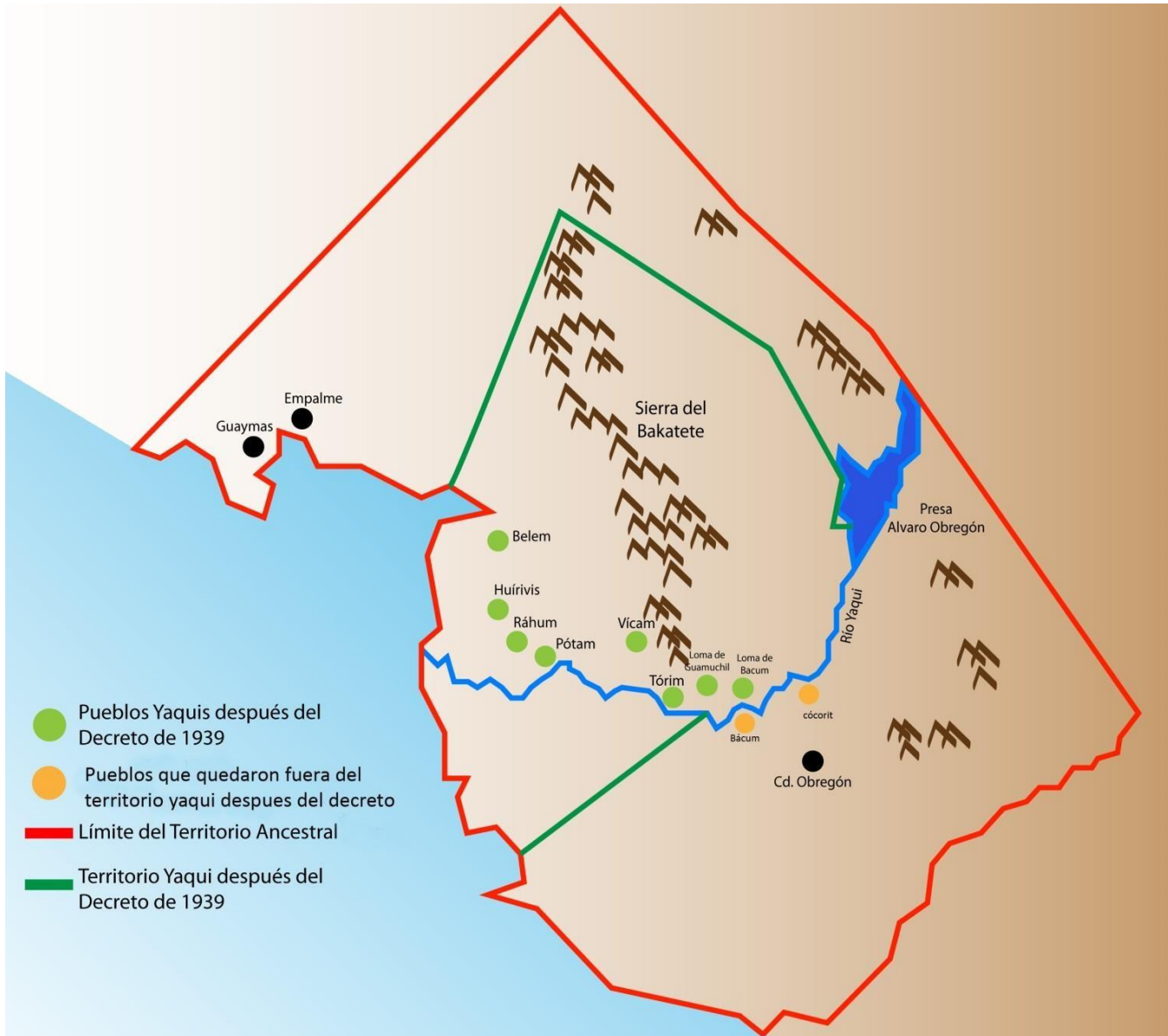
Mapa del territorio yaqui ancestral y actual en donde muestra la ubicación de los ocho pueblos yaquis antes y después del decreto cardenista de 1939. Elaboración propia.

A través de los años esta etnia ha sufrido importantes variaciones en su número de pobladores, a la llegada de los misioneros jesuitas se estimaba que la población yaqui era de 30,000 habitantes 17 , para 1741 un año después de la rebelión de 1740 la