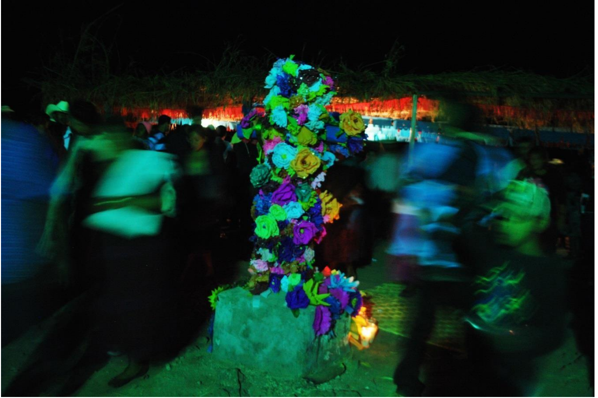
Cruz del perdón en la víspera de la Santa Cruz.