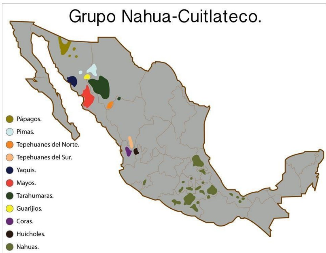
Mapa del territorio mexicano que muestra a los grupos étnicos que pertenecen al grupo Nahua-Cuitlateco. (Tomado de Scheffler, 1992:110) Modificado por Amílcar León.

Dentro de la lengua se encuentra una distinción que se hace aún en la actualidad a yaquis y mayos, únicas lenguas sobrevivientes del grupo “cahita”. Indígenas de una región, con la misma lengua general, tiempo atrás nos dice Spicer (1994) este grupo estaba formado por los yaquis, los mayos del río mayo, los conicarís, los mochicahuis y demás pueblos del río fuerte y otros pueblos hacia el sur hasta Culiacán, que muy probablemente perdieron su identidad en el siglo XVIII.