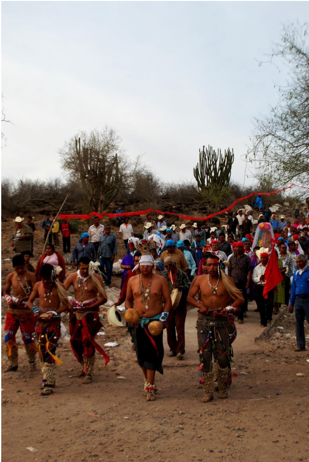
Músicos, danzantes, fiesteros rojos y azules, autoridades religiosas y autoridades militares y gobernadores acompañando a la Santa Cruz.