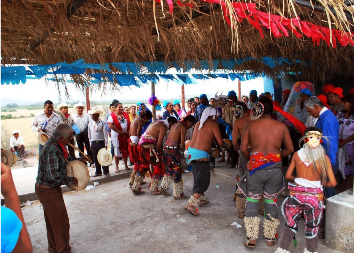
Día 3 de Mayo danzantes y tamburero bailando en lo alto del abajkaure para despedir a la cruz.