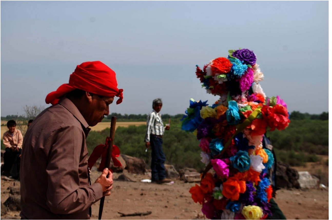
Fiestero rojo frente la cruz del perdón en el cerro del abajkaure .