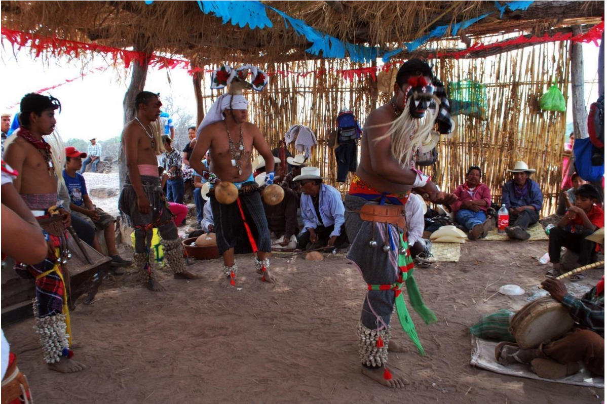
Danzantes de venado y pascola bailando el 3 de Mayo, día de la Santa Cruz en lo alto del abajkaure .