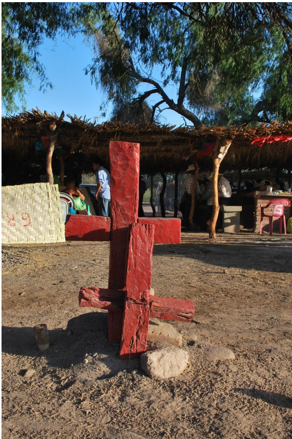
Cruz de los fiesteros rojos.