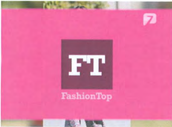
Bumper de salida Fashion Top