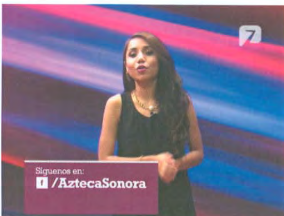
ID de Facebook