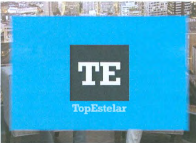
Bumper de entrada

El bumper de entrada es una cortinilla corta que se utiliza al momento de ir a corte comercial.