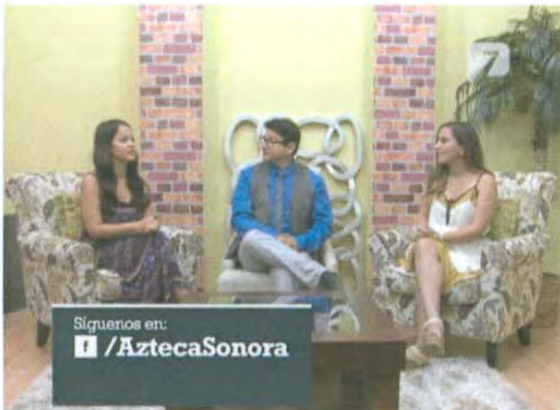
ID de Facebook

La identificación de redes es una barra en la que aparecen las redes sociales de la televisora, a donde pueden estarse comunicando y las que se están repitiendo durante el programa.