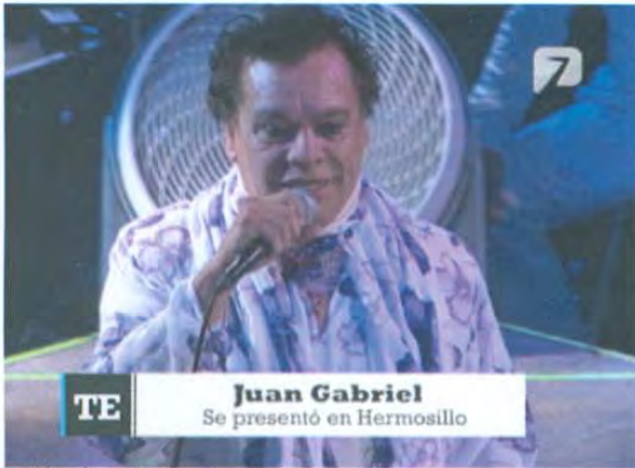
Ejemplo de super

El super sirve para titular la nota y darle identificación mientras está al aire.