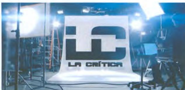
Logotipo de La Crítica

Programa de cine en el cual se dan a conocer los avances cinematográficos, así como los estrenos más recientes en las