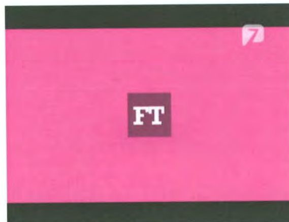
Bumper de entrada Fashion Top