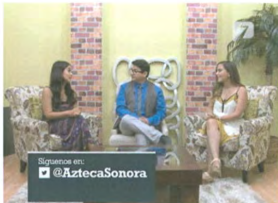
ID de Twitter