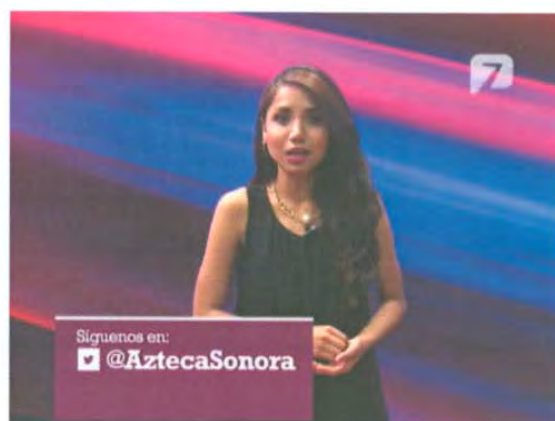
ID de Twitter