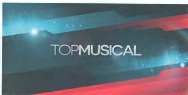
Logotipo de Top Musical

Programa en el cual se presentan principalmente los estrenos musicales, así como los primeros lugares en las listas de