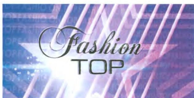
Logotipo de Fashion Top

Programa dedicado dar a conocer temas sobre moda, salud, belleza y eventos locales como pasarelas, con la intención de mantener informados a los televidentes sobre lo mas reciente en estos temas.