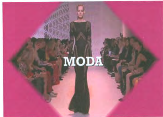
Cortinilla nueva Fashion Top