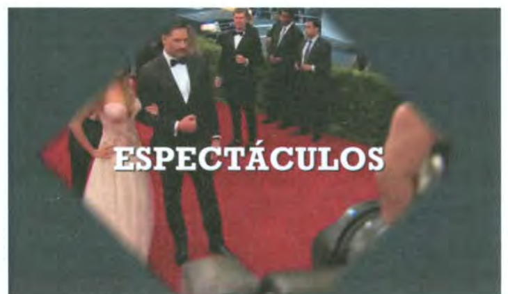
Cortinilla nueva Top Estelar