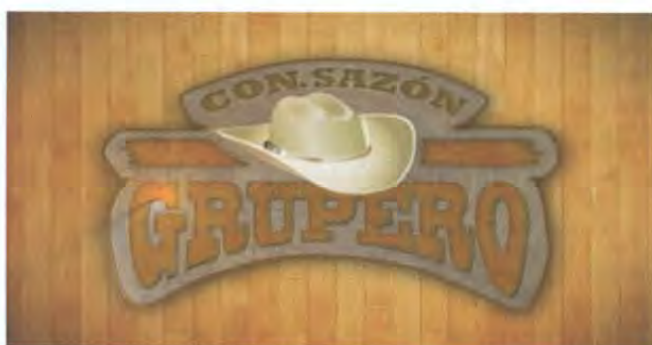
Logotipo de Con Sazón Grupero

Por ser uno de los géneros que más se escucha en nuestro estado, el regional mexicano es el tema principal de este programa, ya que se presentan los videos que se encuentran en los primeros lugares de popularidad.