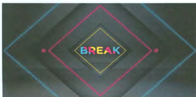
Logotipo de Break

Break es un programa dedicado a difundir novedades y noticias del llamado 'mundo friki'. A través de la transmisión semanal de 15 minutos de programación televisiva se busca dar voz