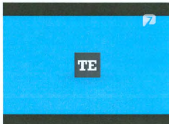
Bumper de salida