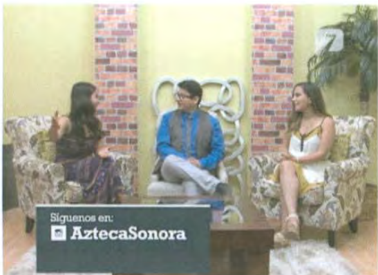
ID de Instagram