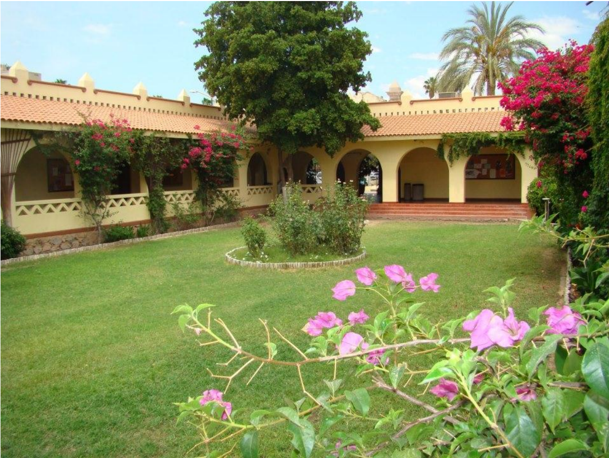
Ilustración 4 Jardín interior del Departamento de Letras y Lingüística de la Universidad de Sonora