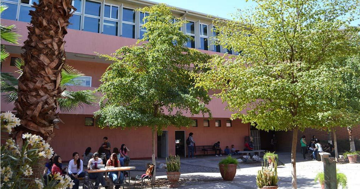
Ilustración 2 Jardín interior del Departamento de Arquitectura y Diseño Gráfico de la Universidad de Sonora