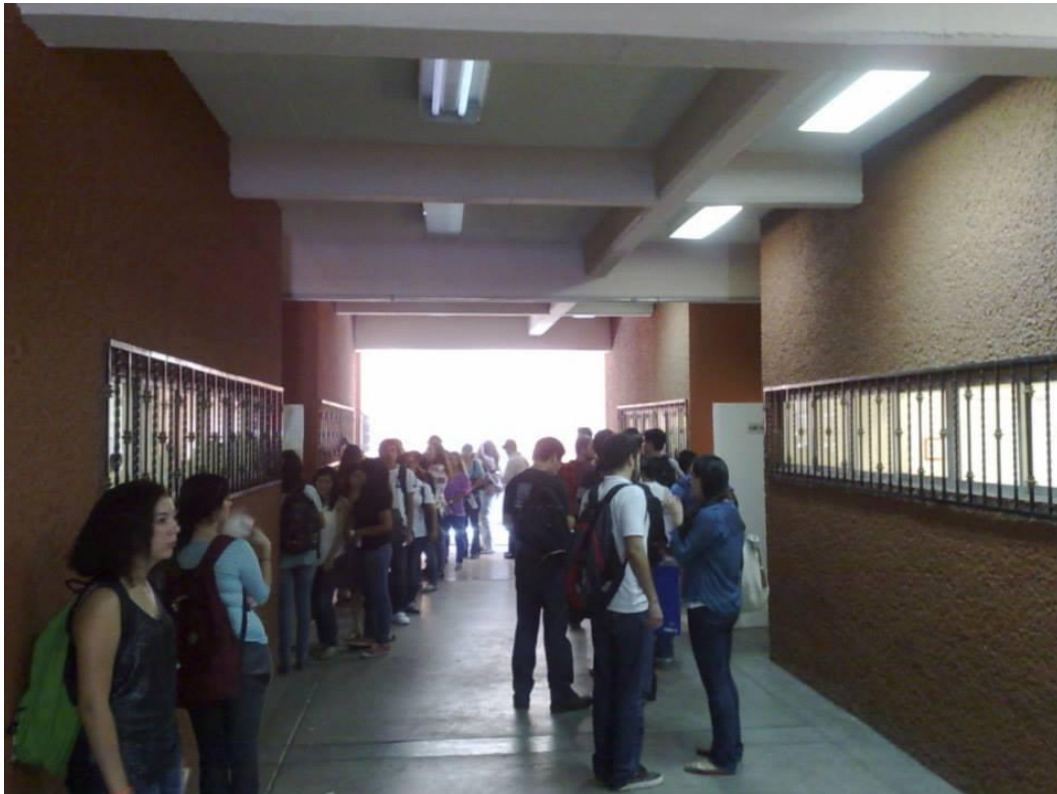
Ilustración 3 Pasillos del Departamento de Lenguas Extranjeras de la Universidad de Sonora