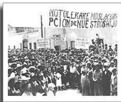
Bassols y la educación sexual. Manifestación de padres de familia.

A raíz de esas proyecciones, se desató una ola de protestas contraria a la educación sexual de los niños. La prensa, especialmente la que estaba interesada en desprestigiar al gobierno, hizo eco de estas manifestaciones y valiéndose de la superstición e ignorancia de los padres de familia, se encargó de despertarles un sentimiento de animadversión, apoyándose fundamentalmente en prejuicios de índole religiosos y morales. Un ejemplo claro es el plebiscito al que intentó convocar el periódico El Universal en 1933, en el que preguntaba: ¿Está usted conforme con que a sus hijos y, especialmente a sus hijas, se les enseñe obligatoriamente en las escuelas los secretos sexuales?