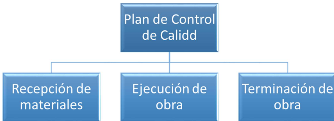
Figura 4.1.1 Elementos del Plan de Control de Calidad

El desarrollo de la metodología se compone principalmente en tres etapas: La primera etapa consiste en la recepción de la información proveniente de los insumos a utilizar en obra apoyados con la Normativa correspondiente para la correcta evaluación de estos. La segunda etapa, ejecución de obra se realizará la revisión y seguimiento del control de calidad, apoyado de Leyes y Reglamentos de construcción. En la tercer etapa terminación de obra , se emitirá un resultado final de conformidad de los materiales utilizados, basado en resultados de calidad y funcionamiento al momento de la entrega de obra, aplicando la legislación-norma-reglamentación respectivo.